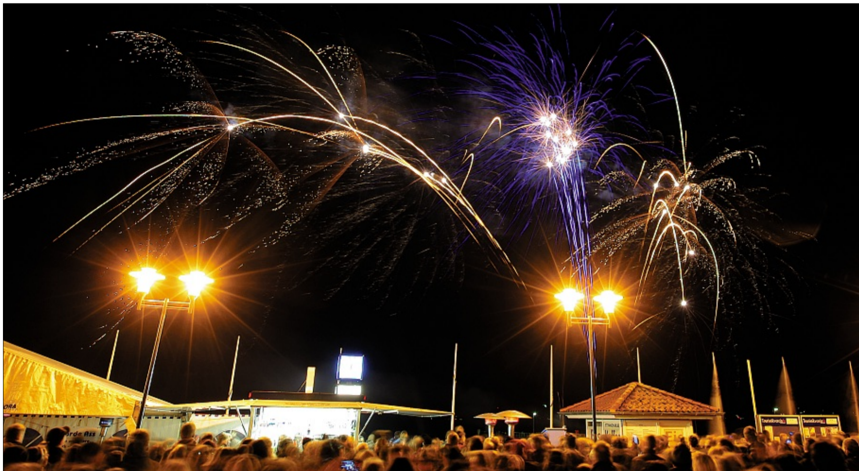
Zuschauen von der böllerfreien Zone: Auch dieses Jahr ist wieder die große Silvester-Open-Air-Party an der Glücksburger Kurpromenade geplant.