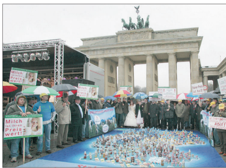
Mit lauter Milchprodukten auf einer Deutschlandkarte protestierten gestern Landwirte beim „Zentralen Aktionstag Milch“ vor dem Brandenburger Tor in Berlin für höhere Erzeugerpreise.

Allen Protesten zum Trotz will der Discounter Aldi laut der „Lebensmittel Zeitung“ den Preis für Milch senken. In Branchenkreisen sei die Rede von bis zu 10 Cent pro Liter, berichtete die Zeitung. Die neuen Preise sollen angeblich bereits ab Montag gelten. Bauernpräsident Sonnleitner warf dem Einzelhandel „Raubtierkapitalismus“ vor. „Unsere Milchbauern sind in allerhöchster Sorge.“ Futtermittel koste 70 Prozent mehr als im Vorjahr. Auch das Agrarministerium stellte sich hinter die Forderungen der Bauern.