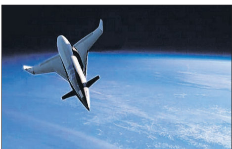
Mit diesem neun Meter langen Raumschiff sollen ab 2011 jeweils vier bis fünf Passagiere ins All fliegen.

hoch fliegenden Flugzeug mit Raketenantrieb. Das Ganze ist nicht mit einer der großen Raketenentwicklungen zu vergleichen“, relativiert Günzel. Das Vorhaben sei aber keine „Spinnerei“, betont er. Alles hat klein angefangen: im Institut für Technologie und Wissenstransfer Talis in Husum. Die Maschinenbauingenieure trafen hier 2004 wieder zusammen. Sie erinnerten sich schnell an ihre gemeinsame Jugendliebe – die Rakete. Die Projektidee entstand. Aufbauend auf dem bis dato ver-